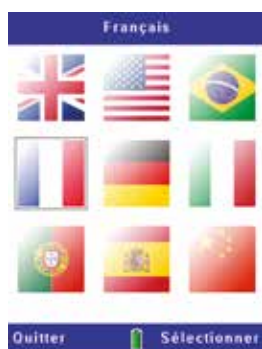
Interface d'utilisateur multilingue