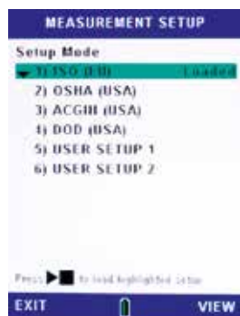
Sélection de réglage